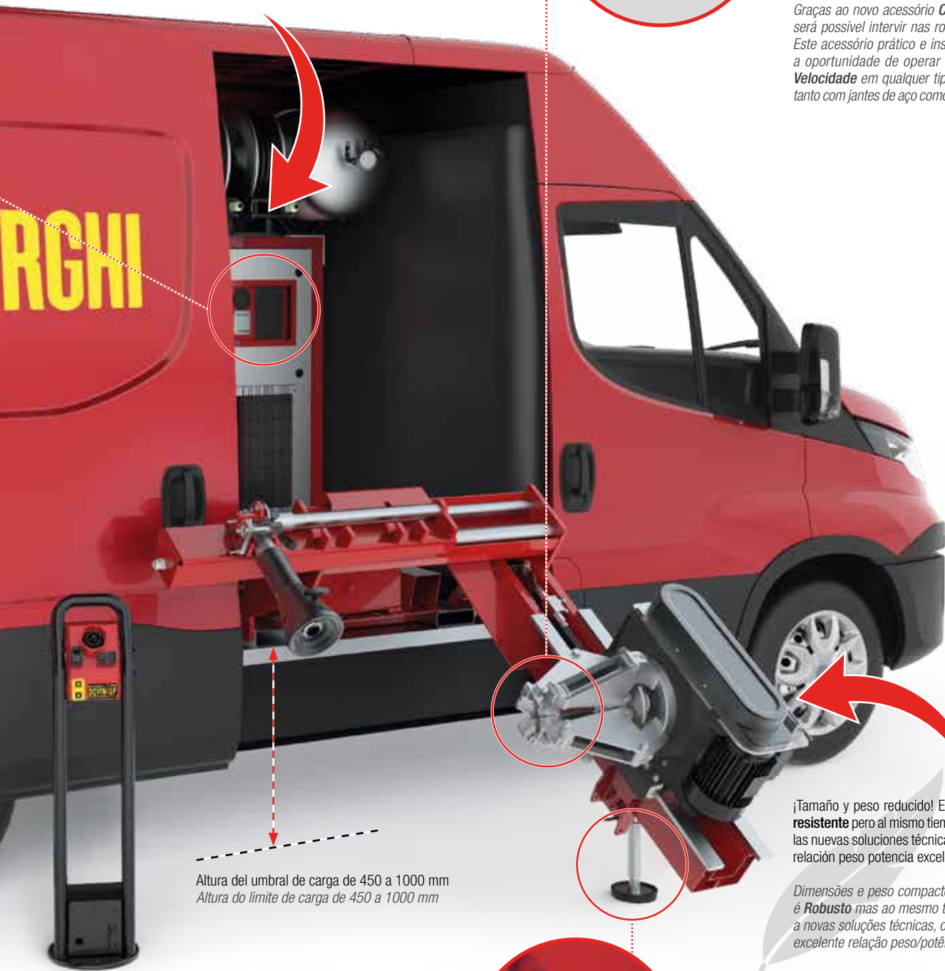
Altura del umbral de carga de 450 a 1000 mm Altura do limite de carga de 450 a 1000 mm

Graças ao novo acessório CAR MATE, também será possível intervir nas rodas do automóvel. Este acessório prático e insubstituível lhe dará a oportunidade de operar com Segurança e Velocidade em qualquer tipo de roda de carro, tanto com jantes de aço como de liga de alumínio.