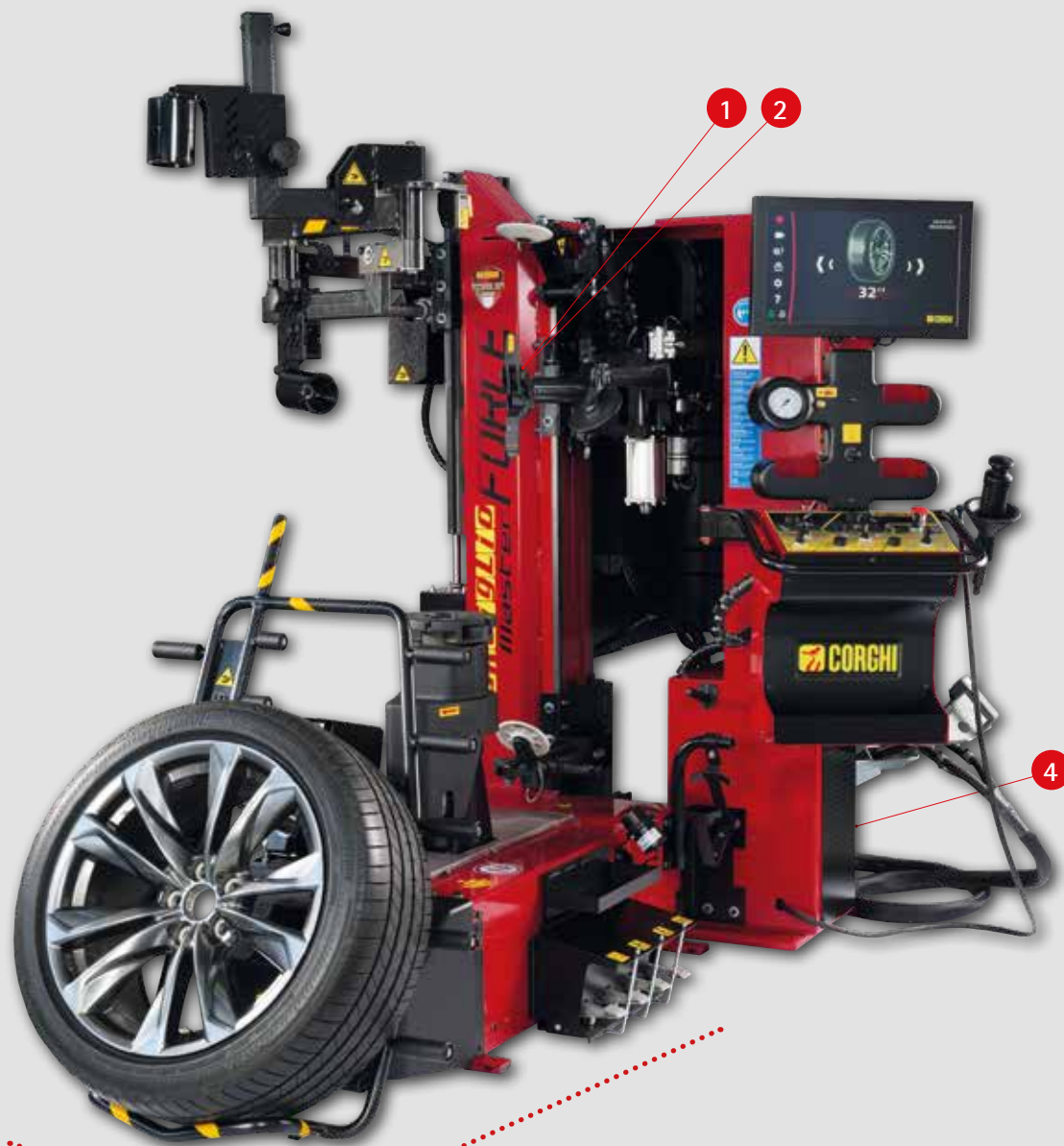
Artiglio Master Force Full Version + System T.I. kit (bajo pedido)