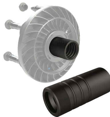
8-21100297 FPF-C SLEEVE HANDLE

Manga para balanceadoras de bloqueio automático. É aparafusada diretamente na FASTPLATE para trabalhar com mais conforto e rapidez