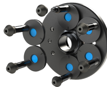
8-21100295 FPF FASTPLATE 3-4-6-8

para aros de 3-4-6-8 furos. Gama de bloqueio 95,25 - 180 mm