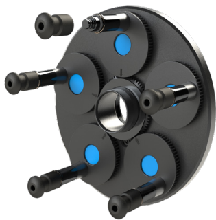
8-21100294 FPF FASTPLATE 5

para aros de 5 furos. Gama de bloqueio 95,25 - 180 mm