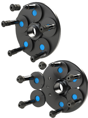
8-21100296 FPF FASTPLATE KIT

para aros de 3-4-5- 6-8 furos. Gama de bloqueio 95,25 - 180 mm