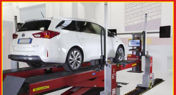
5 Posibilidad de lectura incluso con puente elevado