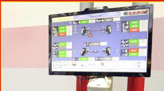
4 Resumen datos alineación