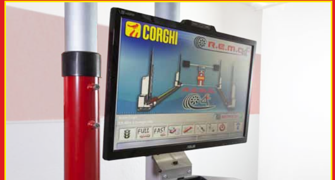
1 El operador selecciona la base de datos

Función "Drive On Assistance": para ayudar al Cliente a posicionar el vehículo en el puente elevador.