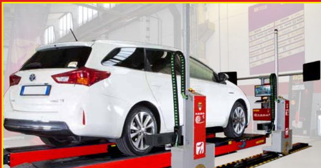
2 Búsqueda puente* - Búsqueda rueda - Medida rueda