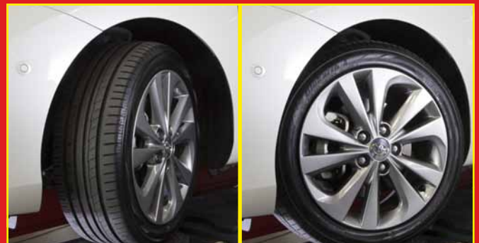
3 Medición parámetros dirección - rueda