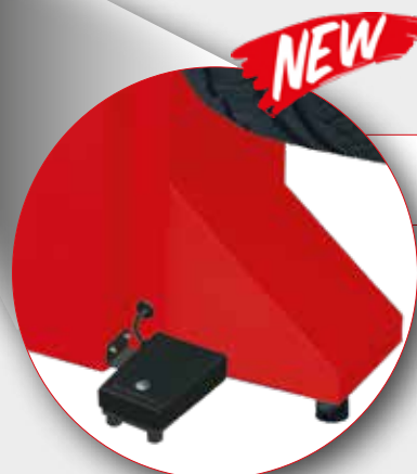
Pédale PNEULOCK PNEULOCK Pedal