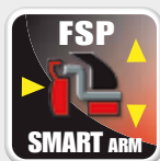
Detector inteligente Detector inteligente