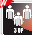
3 operadores 3 operadores