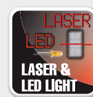
Iluminador led y láser Iluminador de led e laser