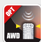
Medidor awd Detector awd