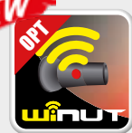
Bloqueo automático con tecnología wireless Bloqueio automático com tecnologia wireless