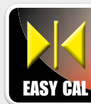
Calibración simplificada Calibração simplificada