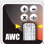
Awc cálculo automático de la anchura Awc cálculo automático da largura