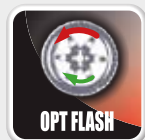
Optimización desequilibrio Otimização do desequilíbrio