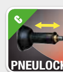
Sistema neumático de bloqueo de la rueda Bloqueio pneumático da roda