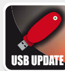
Porte USB e LAN USB & LAN ports