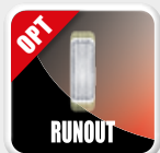
Diagnóstico de descentramiento de rueda Diagnóstico de excentricidade da roda