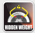
Peso oculto Peso oculto