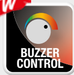
Volumen ajustable Volume ajustável