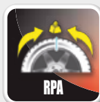
Posicionamiento automático Posicionamento automático