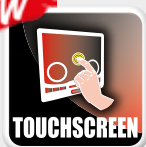
Interfaz táctil Interface Touchscreen